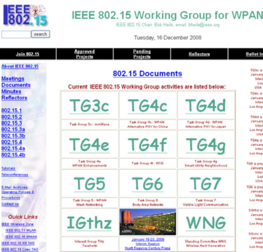
[그림 4] IEEE 802.15 WPAN