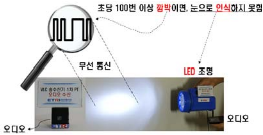
[그림 1] 가시광 무선 통신 파장 대역

당된다. 가청(오디오) 주파수 대역은 20 Hz에서 20,000 Hz에 해당되고, 적외선 파장을 사용하는 IrDA, 2.4 Hz의 IEEE 802.11n, 802.15.1 Blue-tooth, IEEE802.15.3c 60 GHz, 802.15.4 Zigbee UWB 등이 있다. 가시광 무선 통신은 870~900 nm를 사용하는 IrDA와 가장 유사한 파장을 사용하지만, 조명과 동시에 통신을 할 수 있다는 것이 특징이며 장점이다 [3] .